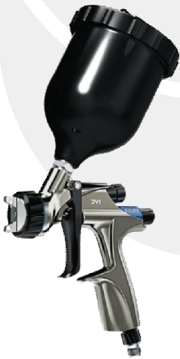
DV1-C-000-11-B+ DV1-C-000-12-B+ DV1-C-000-13-B+ DV1-C-000-14-B+