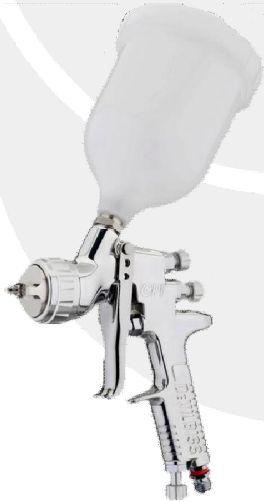
GPI-GP1-14 GPI-GP1-16 GPI-GP1-18